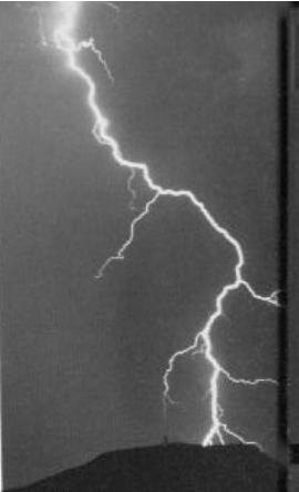
38 Peligro de muerte: los rayos en v